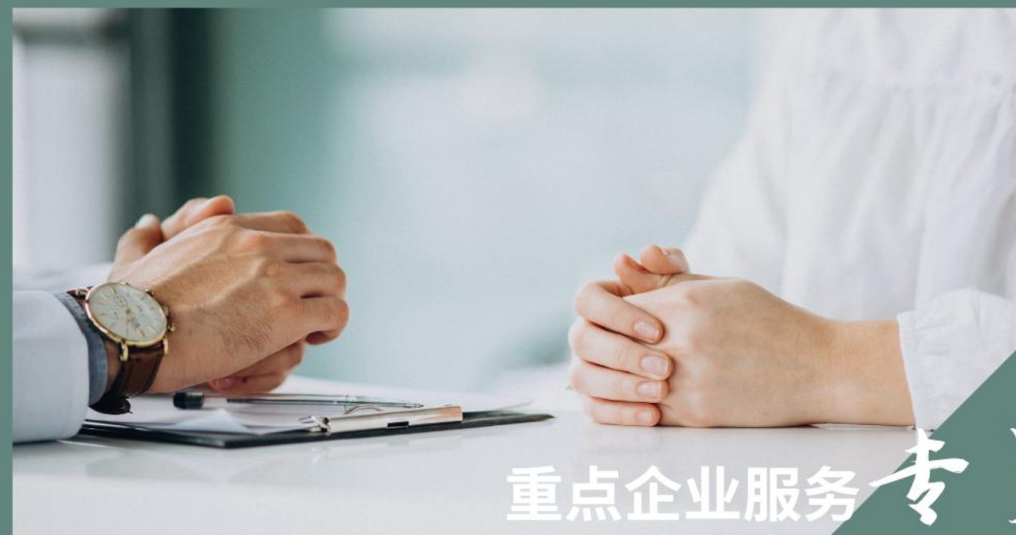
重点企业服务专员

在企业属地服务的基础上，将区四大产业中的重点企业，根据分类由各产业部门匹配专人担任联络员加强日常联系和服务。加强服务企业主体责任，形成以街道（镇）为主（块）、产业部门（条）联动的重点企业条块双联服务机制，通过打好条块“组合拳”，提高企业服务精准度。