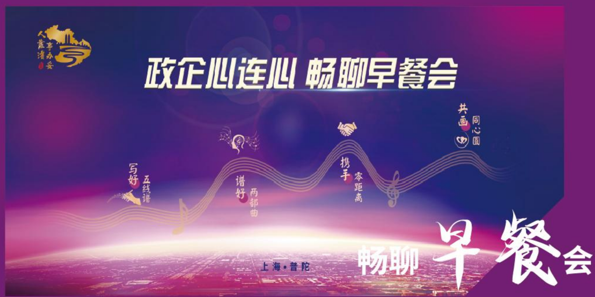
政企心连心 畅聊早餐会

选取部分企业代表作为营商环境特邀体验官，参与区领导“陪伴”企业办理业务、参观区行政服务中心、营商环境体验座谈等活动。听取体验官对我区依法行政、工作实效、服务态度等营商环境方面建言献策，聚焦营商环境薄弱环节，根据企业需求有的放矢提供精准服务，助力打造“人靠谱（普）、事办妥（陀）”一流营商环境。