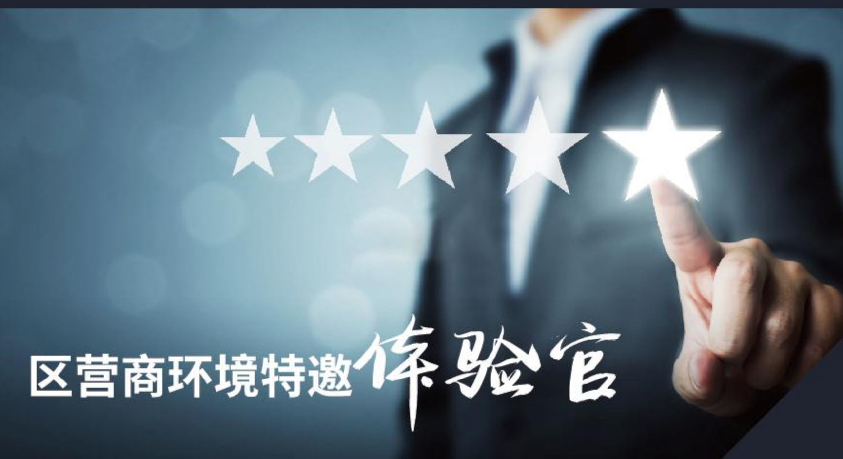
区营商环境特邀体验官

各街道（镇）匹配服务专员对重点企业进行专员制服务。服务专员实时关注企业经营动态，及时掌握如高管人员变更、税收变更、规模变更、股权变更、办公变更等信息。精准对接企业需求，想方设法为企业提供贴心服务，提高服务效能，确保事事有回音、件件有落实，以最快速度解决企业发展问题。