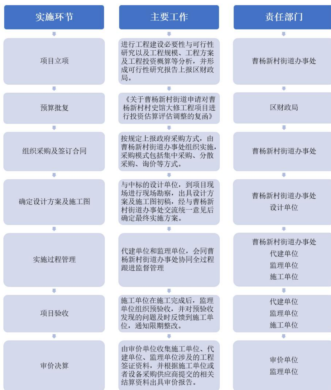
图 1-1：业务管理流程图