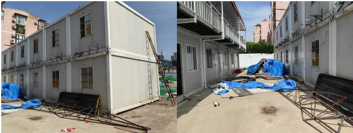
图 2 事发集装箱房