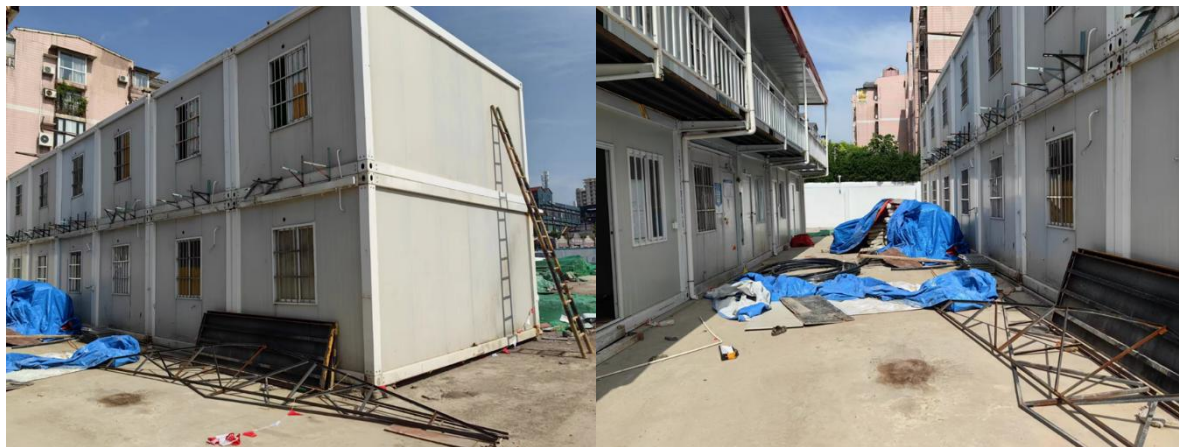
图 2 事发集装箱房