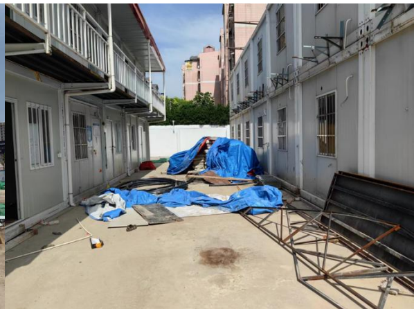
图 3 两栋集装箱房中间坠落点