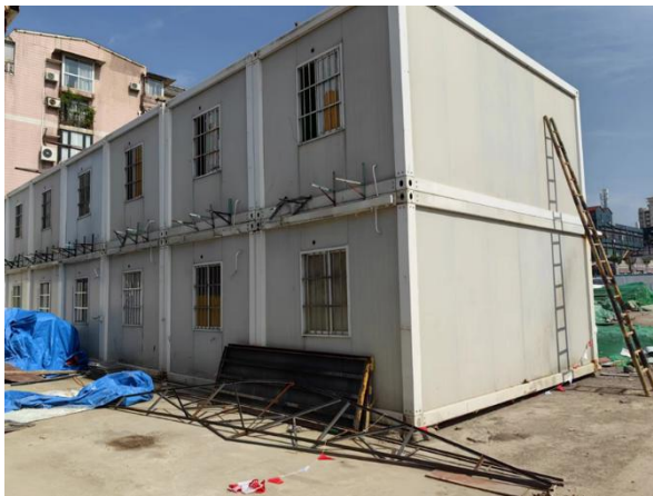
图 2 事发集装箱房

南侧第一、第二栋集装箱房之间有一摊血迹，血迹距离第一栋集装箱房约 2 米，血迹旁散落一只迷彩鞋，边上放有两个集装箱屋顶铁架及其他建筑材料。（图 3）