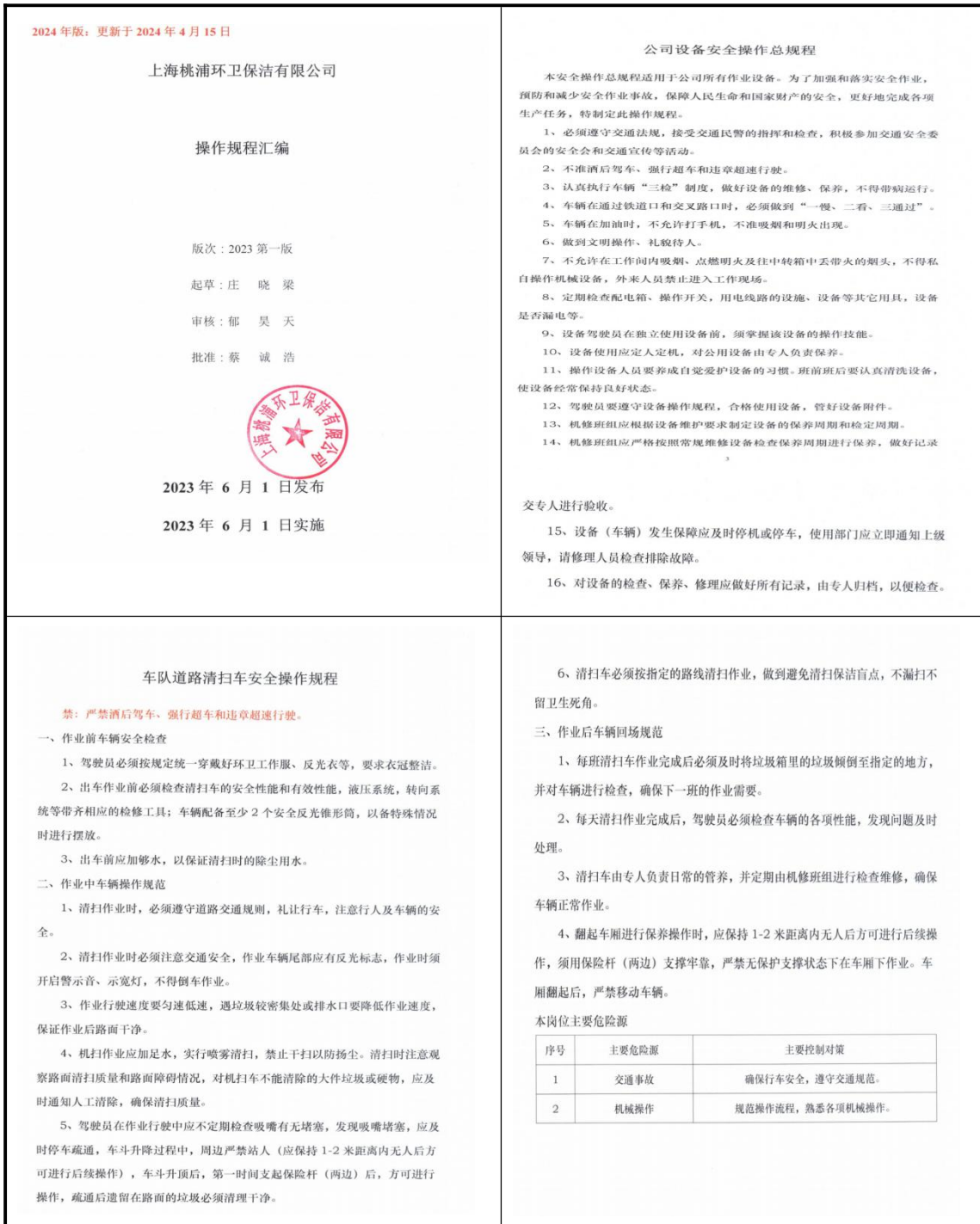
表5 整改防范措施落实情况

5. 桃环公司要建立并落实安全风险分级管控和隐患排查治理双重预防工作机制，定期进行现场检查和隐患排查，加强对安全操作规程执