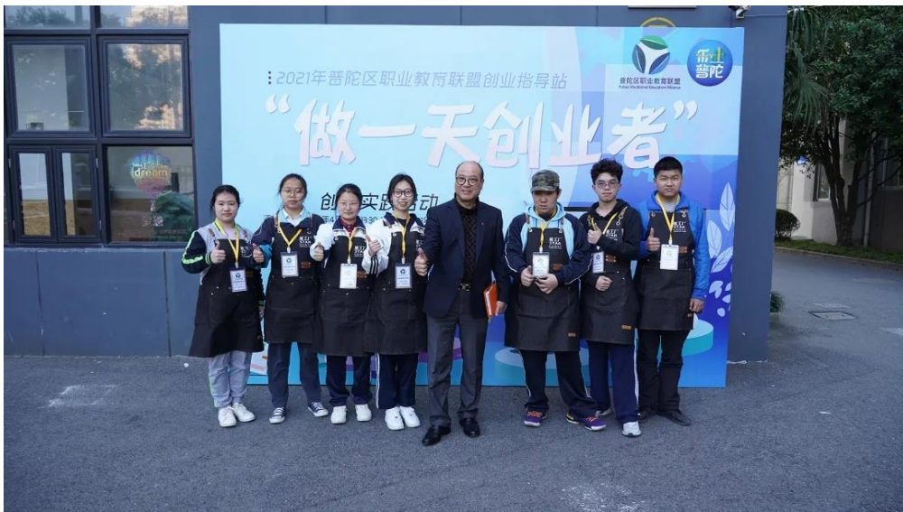
图3：中职学生参加“做一天创业者”活动

4月20、21日，“做一天创业者”普陀区职业教育联盟创业实践活动在红湾创业星工厂举行，通过“培训+实操”模式，学员们“学做一天咖吧老板”，从中了解创业知识，提升就业能力。令人惊喜的是，在咖吧经营的体验实践中，学员们用一天时间创造了1330元营业额的“历史记录”，这批“创业新苗”的能力不容小觑。