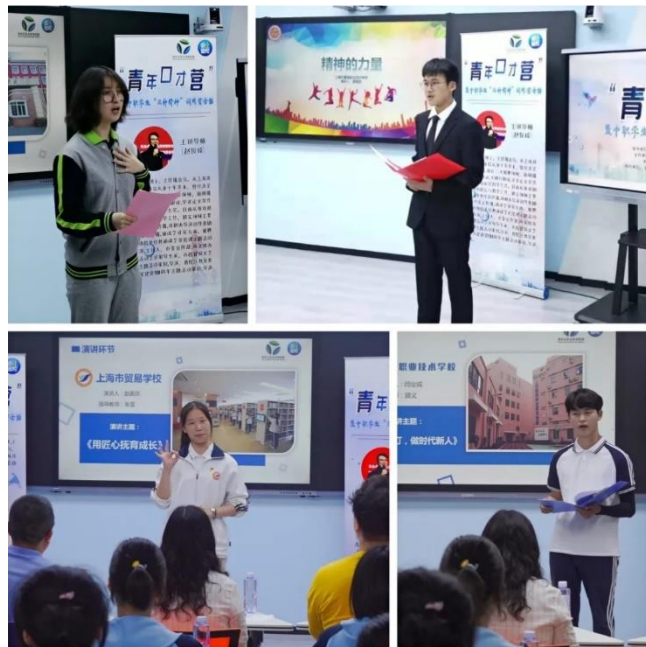
图 1：中职学生“三种精神”口才训练营

“光说不练假把式，又练又说才是真把式。”5月27日下午，普陀区中职学校“青年口才营”暨中职学生“三种精神”训练营活动在曹杨职业技术学校举行。活动由区职业教育联盟主办、创业星工厂承办，特邀上海戏剧学院宋怀强工作室专家为中职学校学生开展“青年